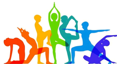
Gym Sainte Aubinoise