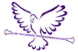
Les Colombes Intercommunales Saint Germer de Fly