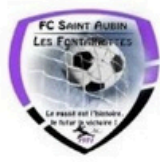
Football club Saint Aubin en BRAY