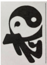
Taïchichuan et Qigong Saint Germer de Fly