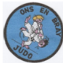
Le Club de Judo Ons en Bray