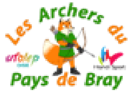
Les Archers du Pays de Bray Blacourt