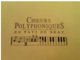
Les chœurs polyphoniques