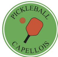
Pickleball Lachapelle aux Pots