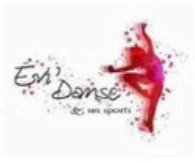
Evi'Danses et ses sports Saint Aubin en BRAY